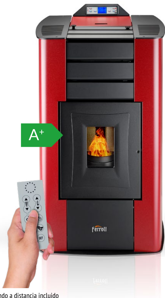
Mando a distancia incluido

Termoestufa de pellets modulante en acero de 18,5 kW