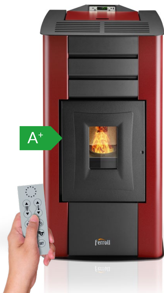
Mando a distancia incluido

Termoestufa de pellets modulante en hierro fundido y acero de 12,7 kW