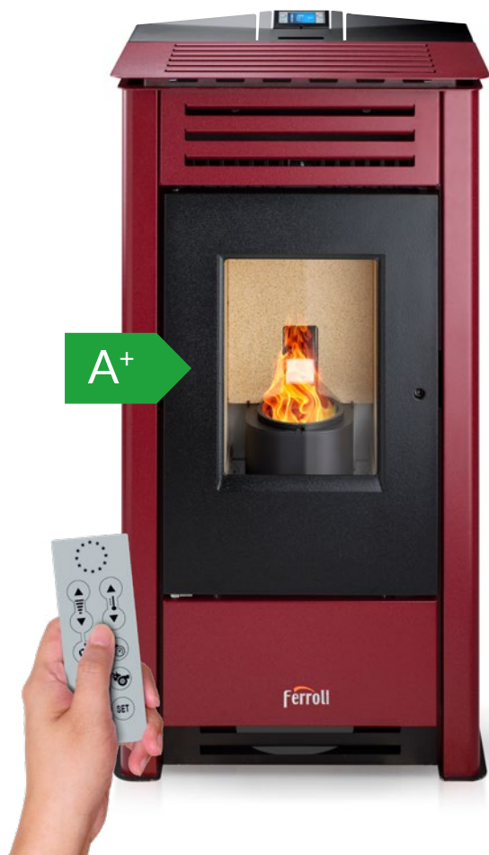
Mando a distancia incluido

Estufa de pellets modulante en acero de 10,41 kW