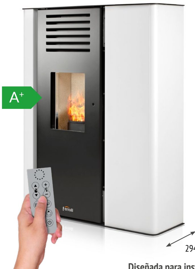
Mando a distancia incluido

Estufa de pellets modulante en acero de fondo reducido de 9 kW