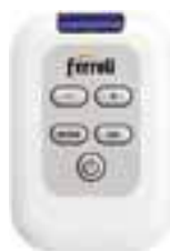
TÉLÉCOMMANDE INFRAROUGE OPTIONNELLE