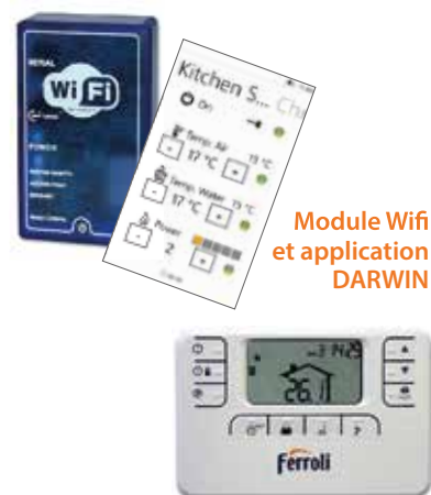
Module Wifi et application DARWIN

Pilotez ou programmez votre insert selon votre rythme de chauffage. Grâce au module Wifi et son application DARWIN (en option) pour gérer à distance de votre appareil via un équipement mobile smartphone ou tablette, ou à l'aide du thermostat d'ambiance OSCAR (en option) pour programmer son fonctionnement.